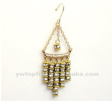
Pendientes = cuerdas de collares.