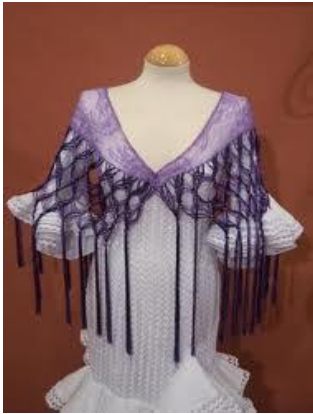
Mantoncillos= capa para envolverse.