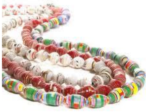
Brazaletes = cuentas perforadas para pasar un hilo