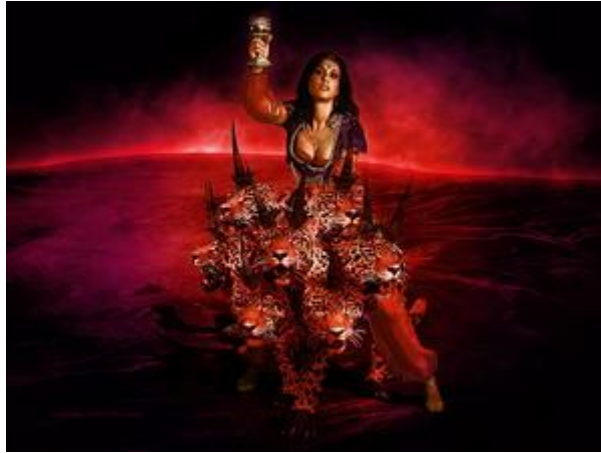
La mujer de Caín se vestía como ramera.

Si seguimos sus pisadas es porque somos sus hijos.