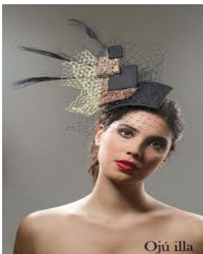
Tocados= turbantes que usaban los reyes y sumos sacerdotes.