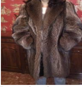
Ropas de gala= ropa para los lomos.