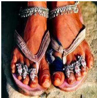
Atavíos de las piernas = joyas para los pies.