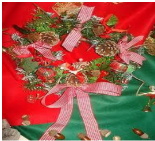
Cofias = Coronas de guirnalda.