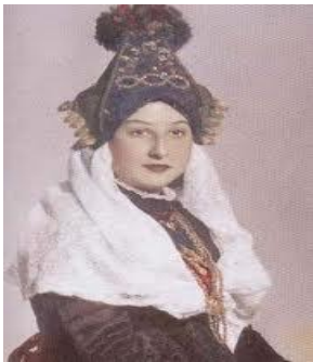
Velos= vestido exterior bordado con hilos metálicos preciosos de uso en las personas con dinero.